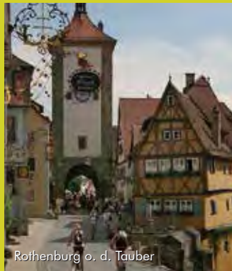
Rothenburg o. d. Tauber