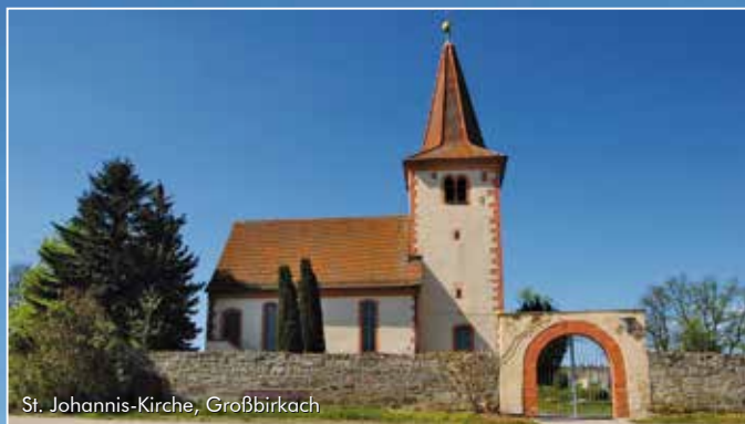
St. Johannes-Kirche, Großbirkach