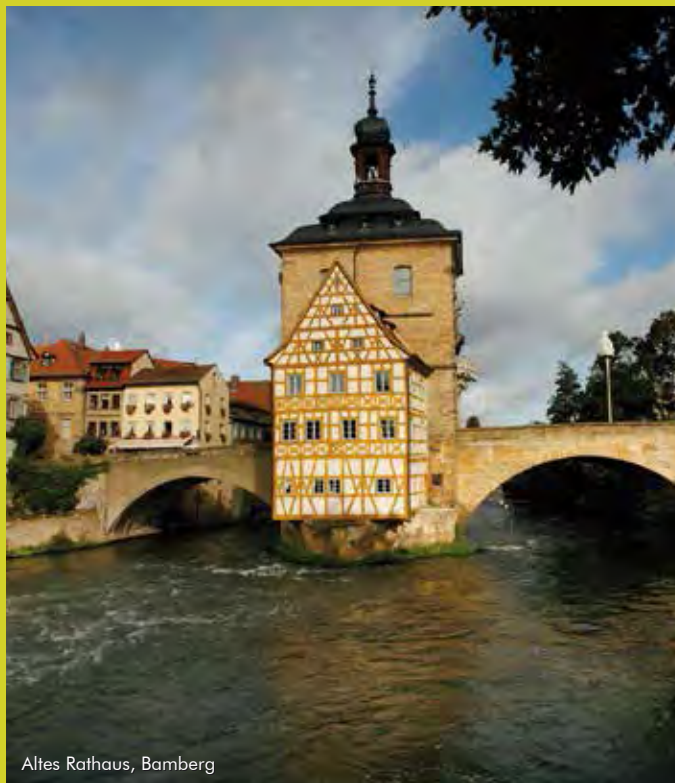
Altes Rathaus, Bamberg