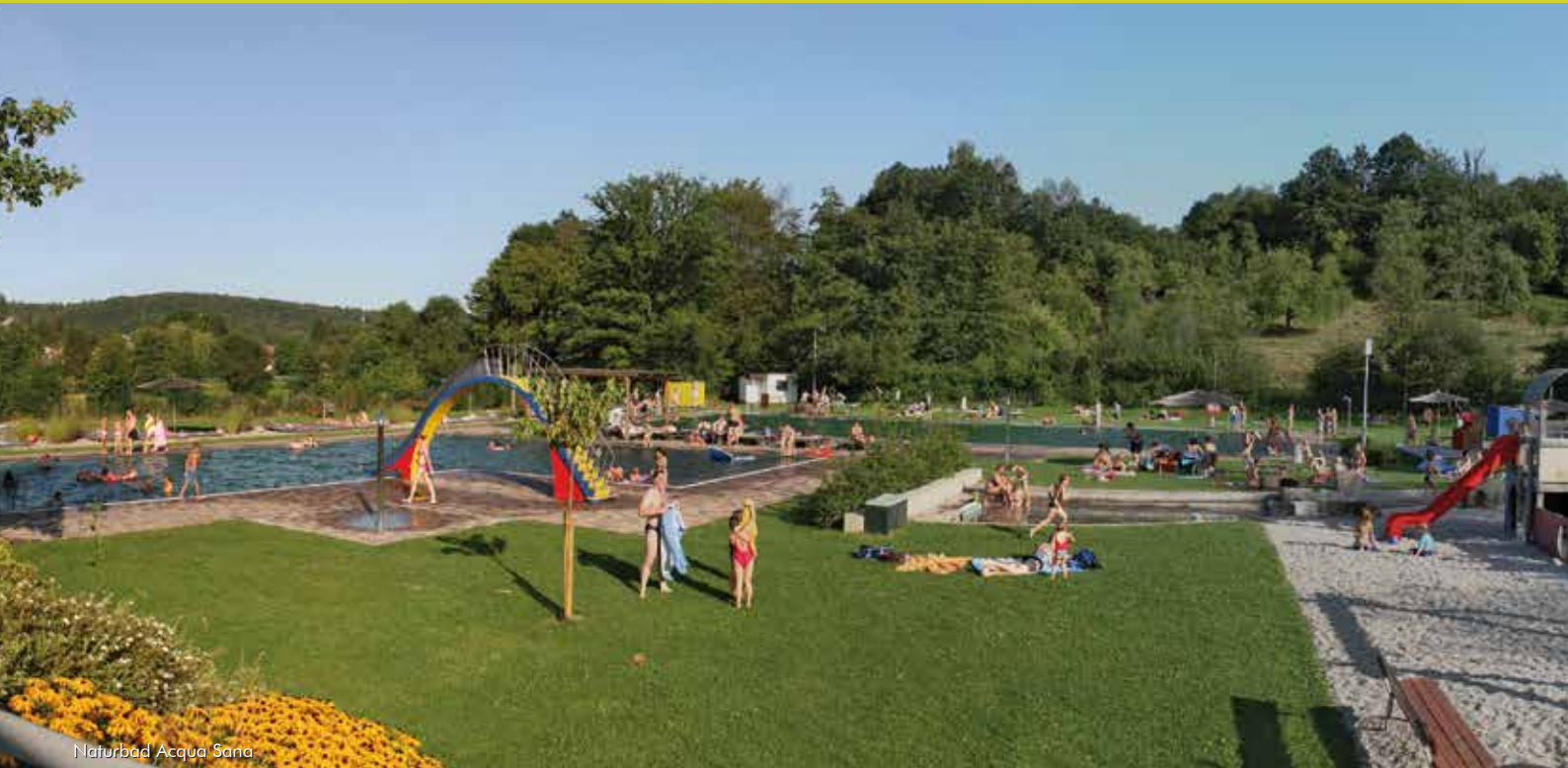
Naturbad Acqua Sana

In Burgwindheim können Sie bei schönem Wetter am Boccia-Platz mit Freunden zusammen das Leben genießen.