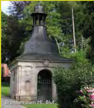
Brunnen zum Hl. Blut