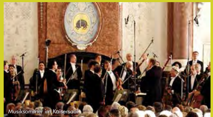
Musiksommer im Kaisersaal

Nähere Informationen: www.ebracher-musiksommer.de