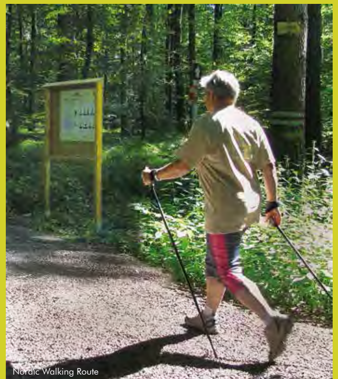
Nordic Walking Route