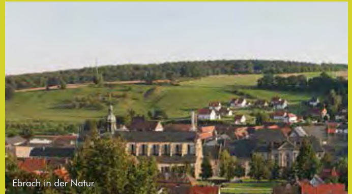
Ebrach in der Natur