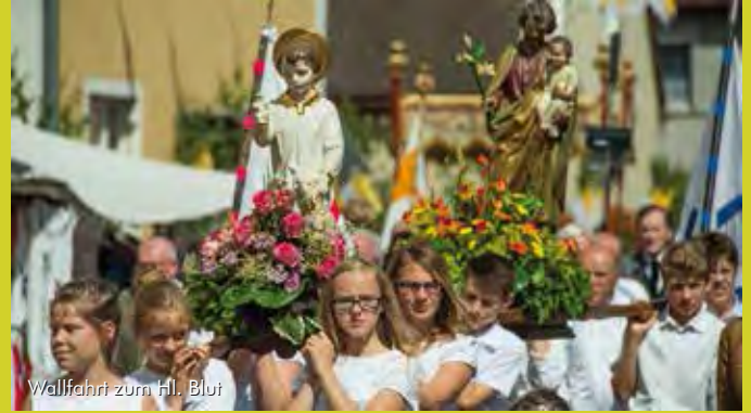
Wallfahrt zum Hl. Blut

Besonders beeindruckend ist die am darauffolgenden Samstagabend gemeinsam mit den Volkacher Pestwallfahrern stattfindende sakramentale Lichterprozession.