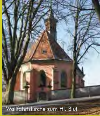
Wallfahrtskirche zum Hl. Blut

Bis heute wird eine Woche nach Fronleichnam die Wallfahrt zum Heiligen Blut gefeiert. Dann schmückt sich der ganze Ort im festlichen Gewand und lockt zahlreiche Besucher und Gläubige aus Nah und Fern an, die das über 550 Jahre alte traditionsreiche Kirchenfest eindrucksvoll erleben können.