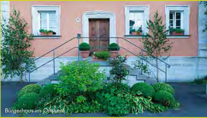
Bürgerhaus im Ortskern