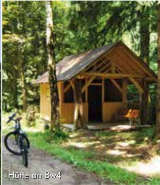
Hütte an Bw4