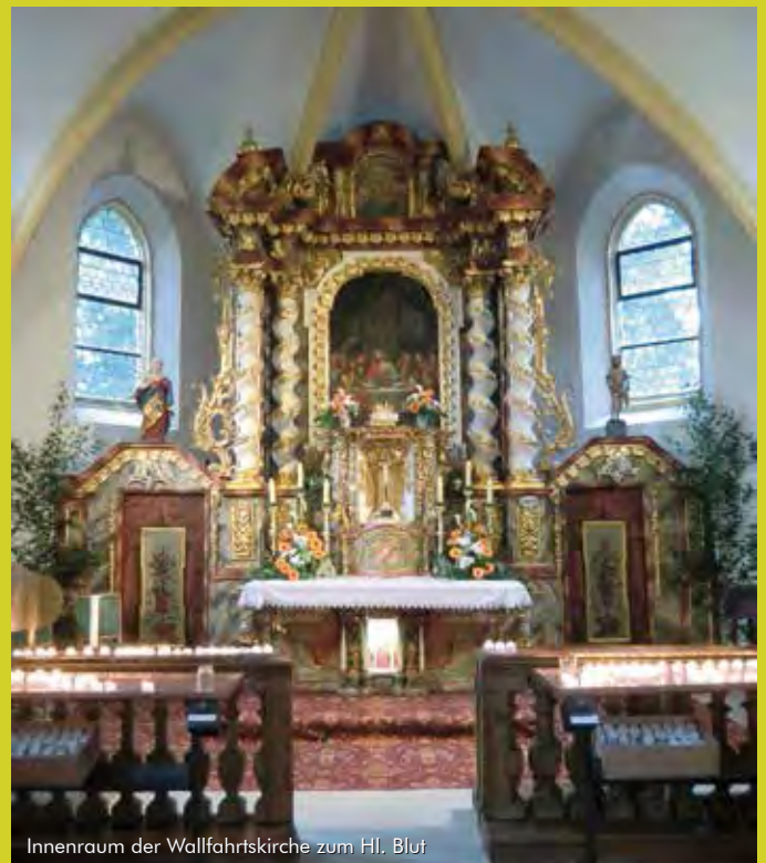
Innenraum der Wallfahrtskirche zum Hl. Blut

Nähere Informationen zu Führungen, Öffnungszeiten und Kontaktdaten finden Sie auf Seite 23 und auf der Rückseite.