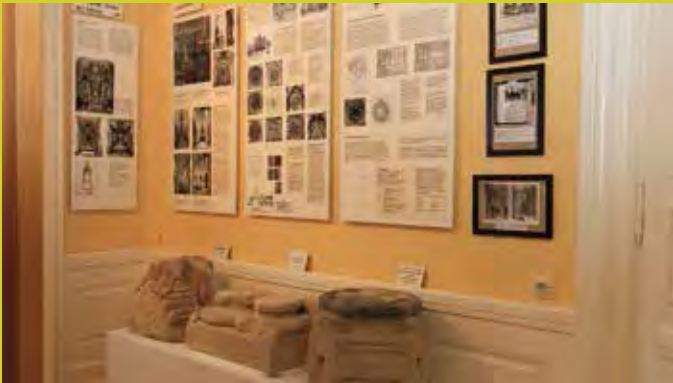
Museum der Geschichte Ebrachs

Auch Führungen zu einem Wasserkraftwerk in einem ehemaligen Mühlgebäude können nach Rücksprache durchgeführt werden.