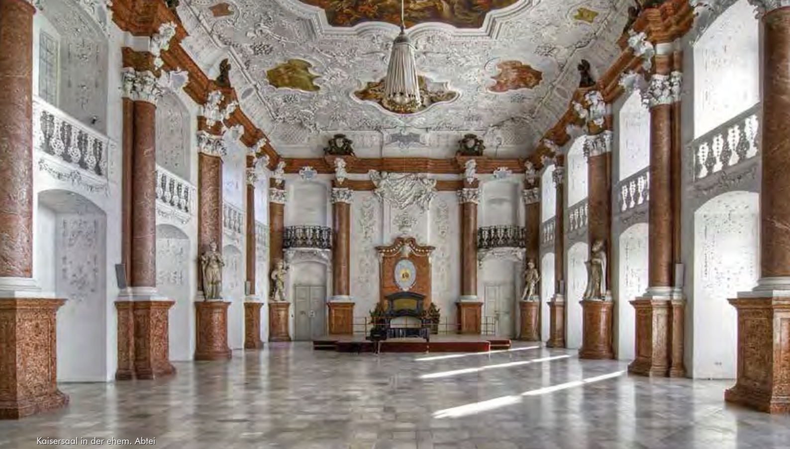
Kaisersaal in der ehem. Abtei