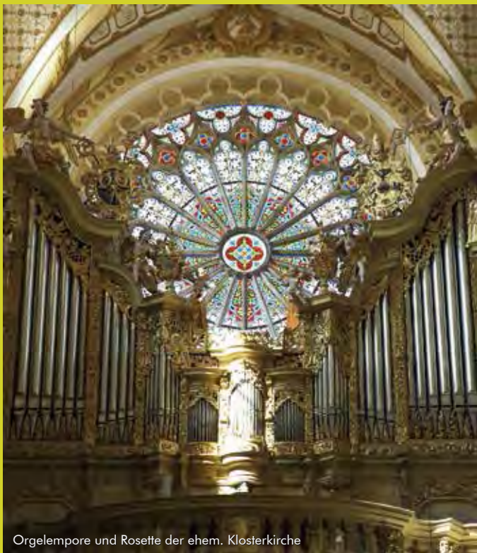
Orgelepore und Rosette der ehem. Klosterkirche