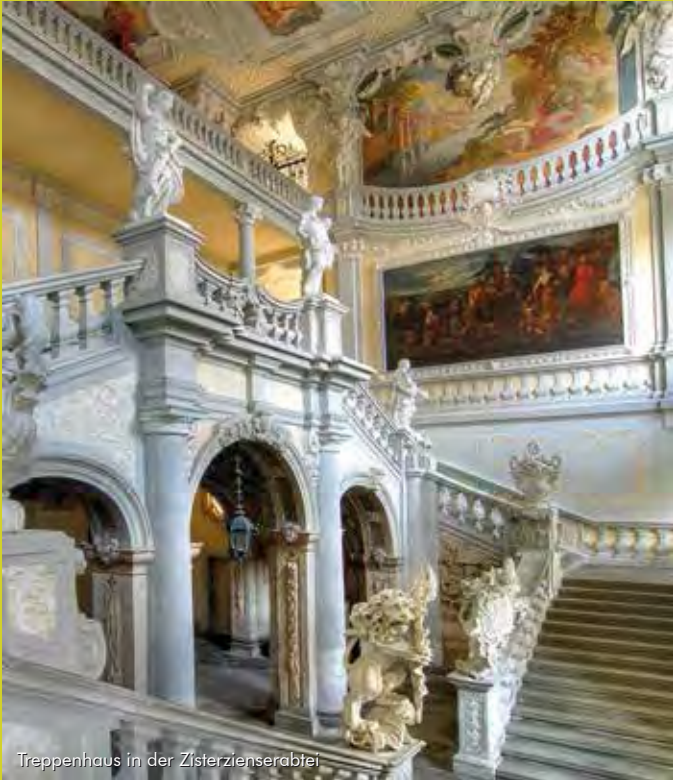
Treppenhaus in der Zisterzienserabtei

Von einer hochinteressanten Vergangenheit erzählen die Zeugnisse der Zisterzienser in unserer Region. Ein Orden, der schon vor langer Zeit beide Orte stark miteinander verbunden hat. Vor allem an der mächtigen und beeindruckenden Klosteranlage in Ebrach und am prachtvollen Barockschloss in Burgwindheim lässt sich der einstige Reichtum des Ordens ablesen.