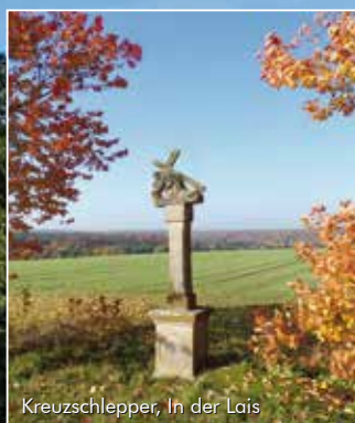
Kreuzschlepper, In der Lais