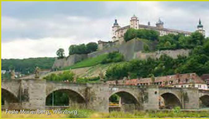
Feste Marienberg, Würzburg