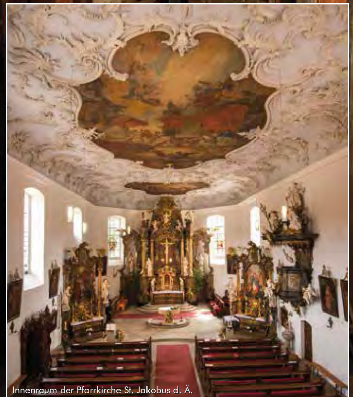
Innenraum der Pfarrkirche St. Jakobus d. Ä.