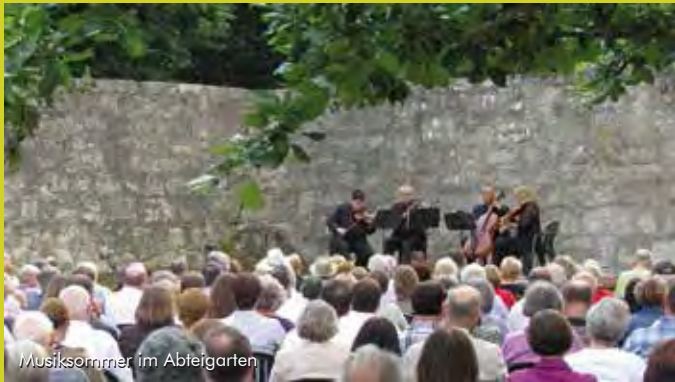
Musiksommer im Abteigarten