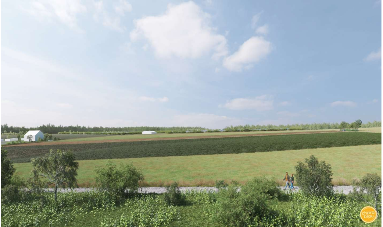
Blick von Südosten nach Nordwesten, Visualisierung der Anlage mit Darstellung der Hecken an den südlichen Rändern

Die folgenden zwei Abbildungen zeigen die Blickrichtung vom westlichen Ortsrand von Oberweiler nach Nordosten.