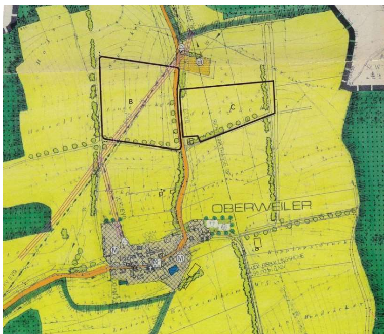
Ausschnitt aus dem Flächennutzungsplan mit Umgrenzung des Geltungsbereichs

Plangrundlage ist die digitale Flurkarte.