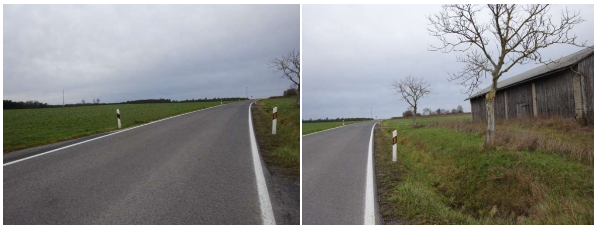
Blick nach Norden