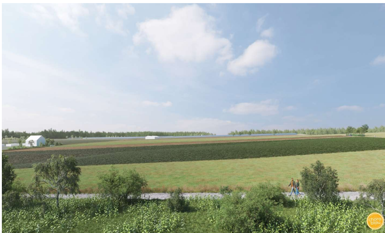
Blick von Südosten nach Nordwesten, Visualisierung der Anlage ohne Darstellung der Hecken an den südlichen Rändern

Zur Erläuterung der Auswirkungen auf das Landschaftsbild wurden Visualisierungen der Anlage von zwei Standorten aus angefertigt. Die Blickrichtung der ersten Abbildung geht von östlich der Ortschaft Oberweiler nach Nordwesten. Das letzte Haus am Ortsrand und die Feldscheunen sind sichtbar.