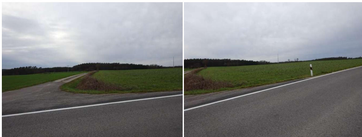
Blick nach Westen von der Kreisstraße BA23 aus mit Blick auf die querende 20KV-Leitung

Der nördliche Steigerwald ist eine vielfältige Landschaft mit großen Waldgebieten zur westlichen Schichtstufe hin. Die Hochlagen des nördlichen Steigerwalds sind durch großflächige Wälder und kleine Weiler in Waldinseln geprägt. Diese Waldinseln sind landwirtschaftlich genutzt. Oberweiler liegt in einer Mulde, die nach Nordwesten zum Tal der Mittelebrach führt. Das Planungsgebiet zieht sich nach Norden hoch. Die Ackerflächen sind offen und unstrukturiert. Am Südrand der westlichen Fläche stehen zwei Obsthochstämme, ein weiterer Obsthochstamm steht nach den Feldscheunen am südlichen Rand der geplanten Solarfläche.