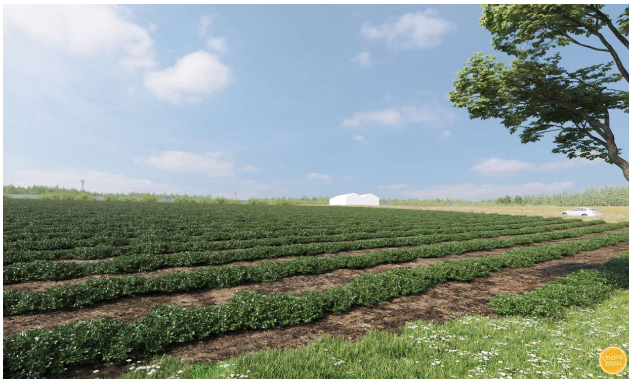
Blick von Südwesten nach Nordosten auf die Feldscheunen, Visualisierung der Anlage mit Darstellung der Hecken an den südlichen Rändern

Auch hier werden die geplanten Anlagen in weiten Bereichen wenn die Hecken entwickelt sind verdeckt sein.