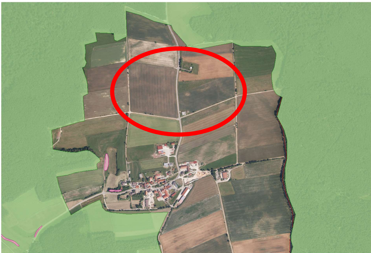
Ausschnitt aus dem Fachinformationssystem FIS der Landesanstalt für Umwelt, mit kartierten Biotopen und den Landschaftsschutzgebieten (ehem. Schutzzone Naturpark), ohne Maßstab

Das Planungsgebiet liegt im Naturpark Steigerwald, nicht jedoch innerhalb des Landschaftsschutzgebietes (ehemals Schutzzone Naturpark Steigerwald). Es liegt in keinem Flora-Fauna-Habitat oder sonstigem Schutzgebiet. Innerhalb des Planungsgebietes liegen keine kartierten Biotope, Biotope nach § 30 BNatSchG oder geschützte Landschaftsbestandteile.